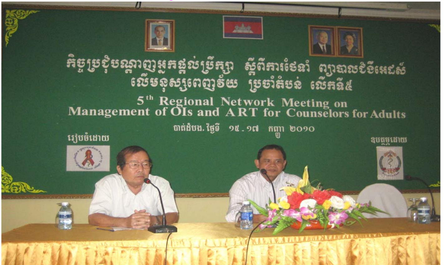
The 5th Regional Counselor Network Meeting on Management for OIs and ART for Adults 15-17 September 2010